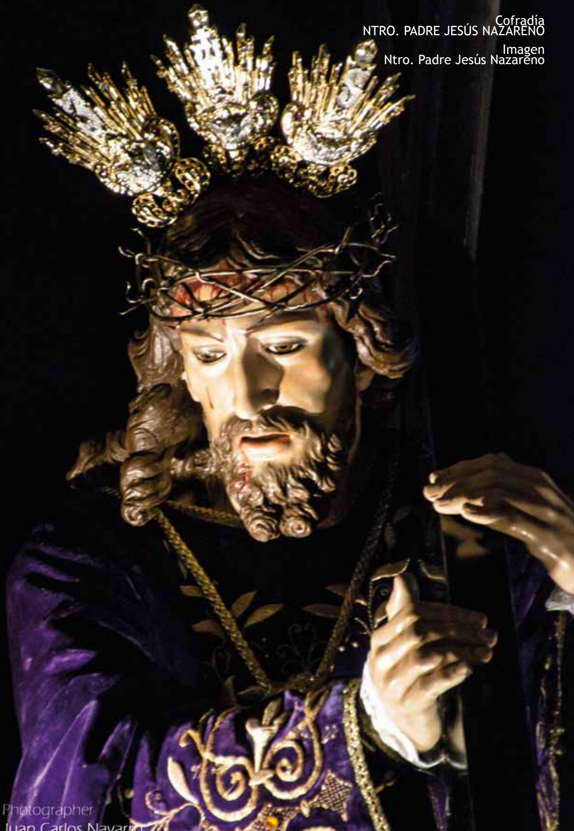
Imagen Ntro. Padre Jesús Nazareno