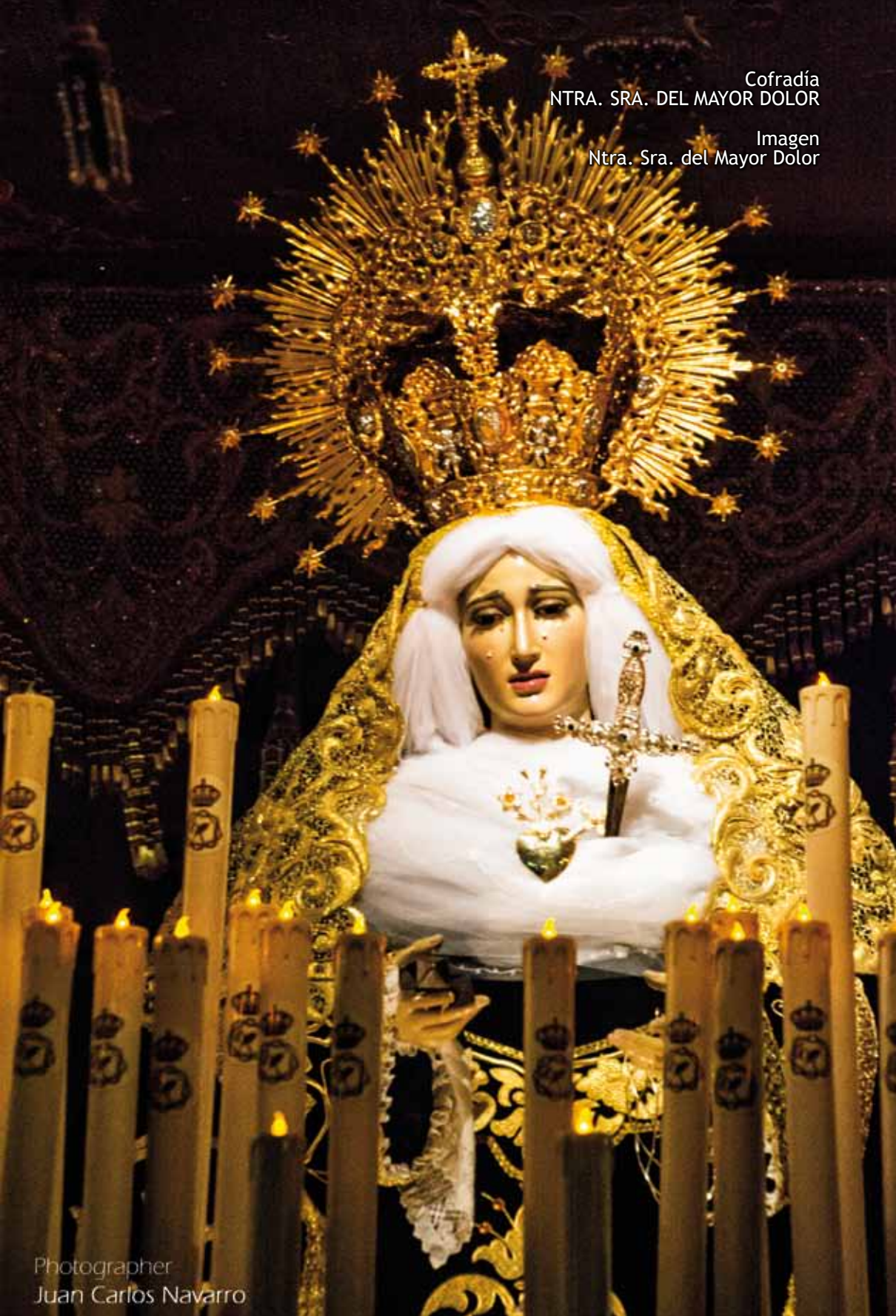
Imagen Ntra. Sra. del Mayor Dolor