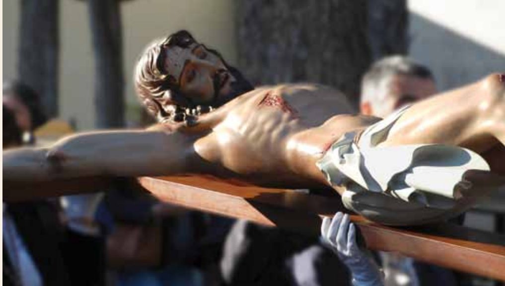
Cofradía VENERABLE, ANTIGUA Y PENITENCIAL DEL SANTÍSIMO CRISTO DE LA SANGRE