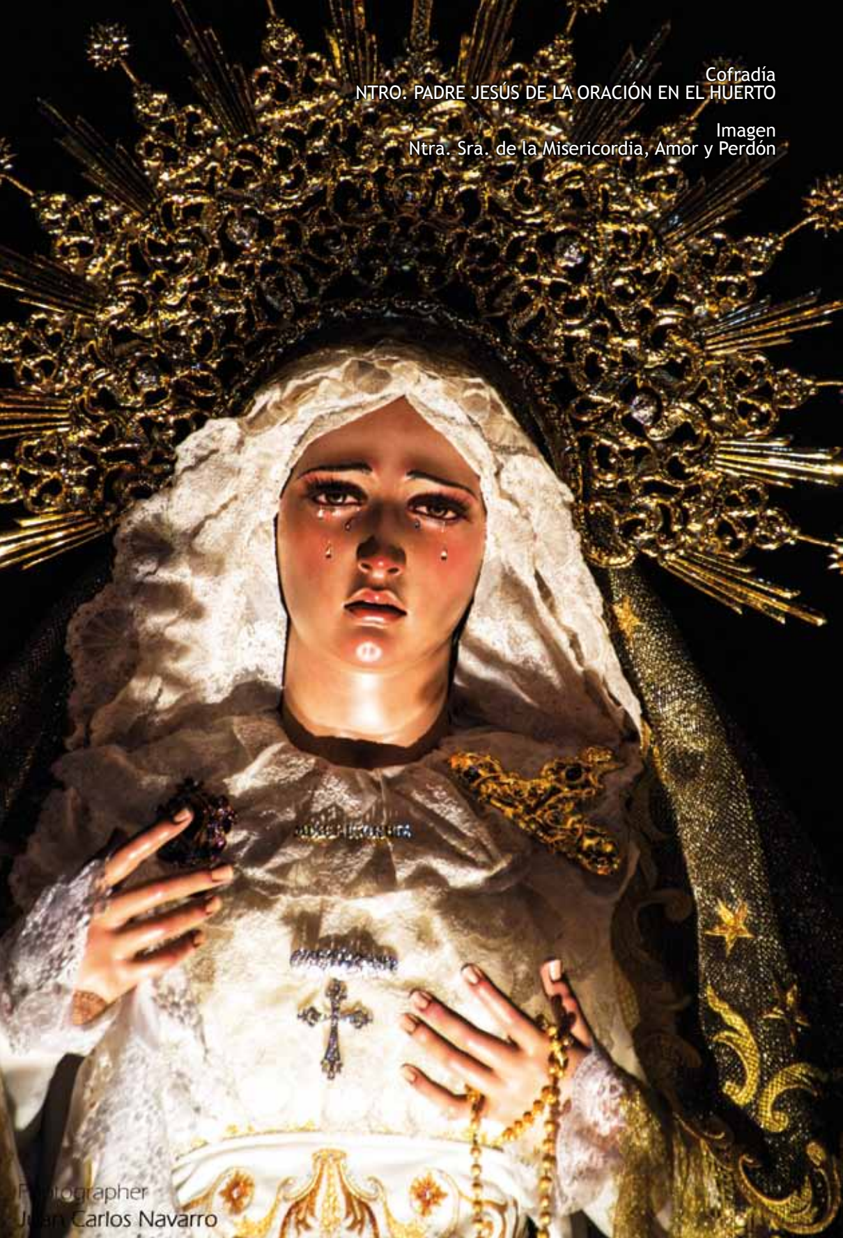
Imagen Ntra. Sra. de la Misericordia, Amor y Perdón

Cofradía INTRO. PADRE JESÚS DE LA ORACIÓN EN EL HUERTO