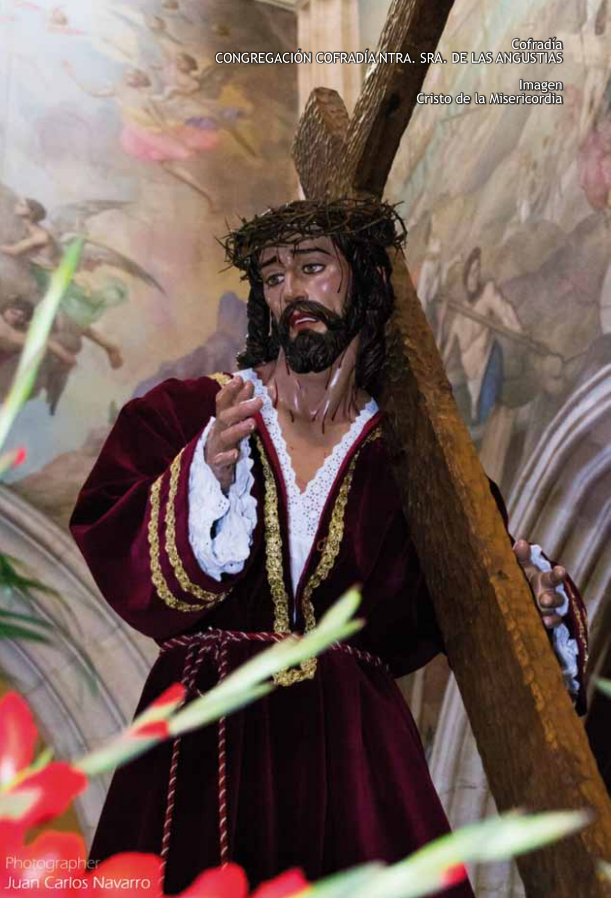
Imagen Cristo de la Misericordia

Cofradía CONGREGACIÓN COFRADÍA NTRA. SRA. DE LAS ANGUSTIAS