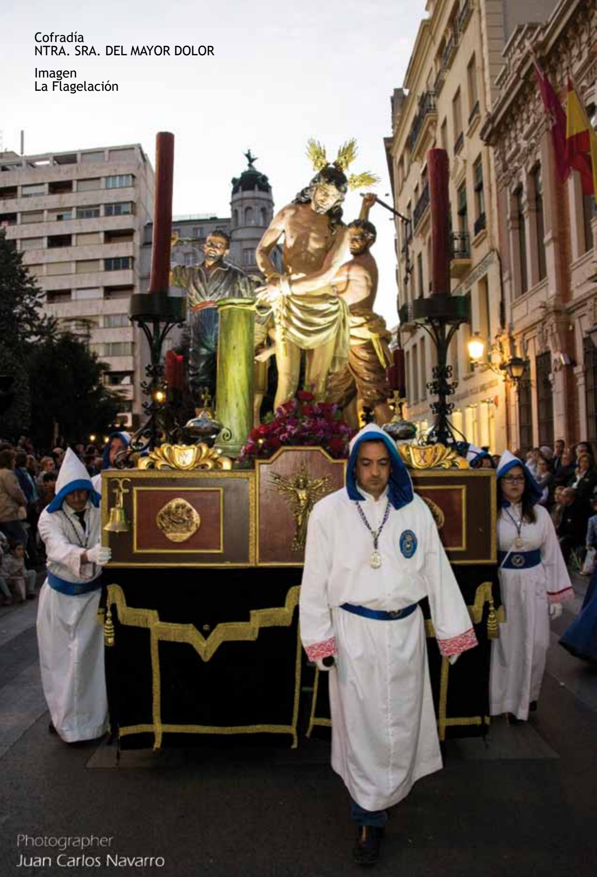
Imagen La Flagelación