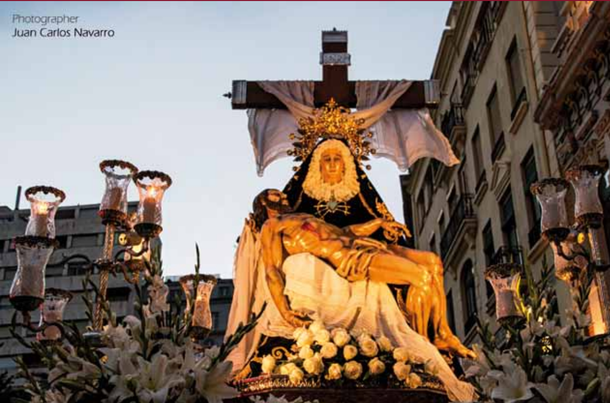
Imagen Ntra. Sra. de las Angustias

Cofradía CONGREGACIÓN COFRADÍA NTRA. SRA. DE LAS ANGIUSTIAS