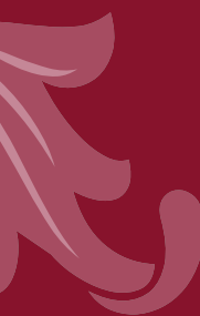
Imagen La Verónica