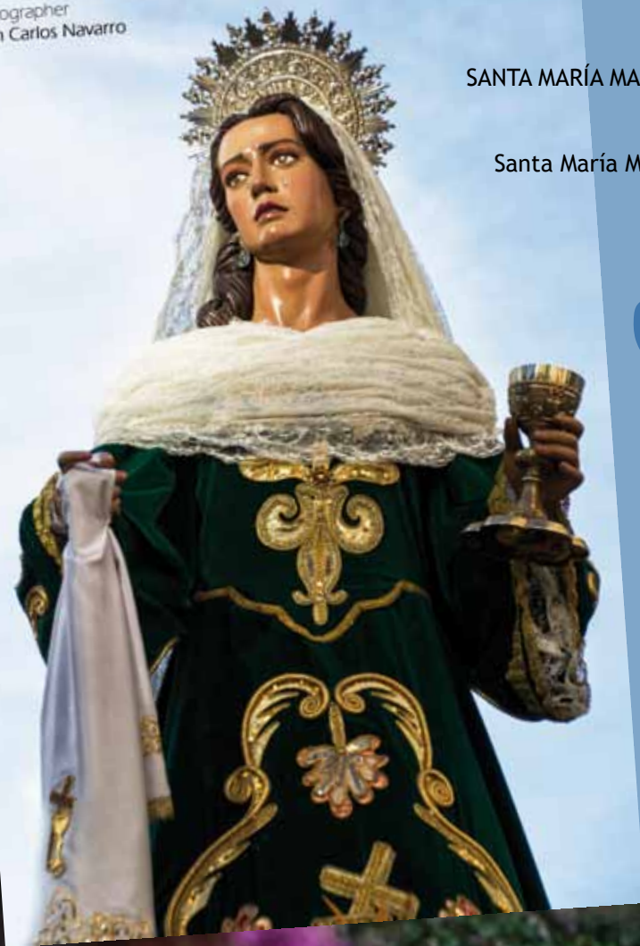
Imagen Santa María Magdalena