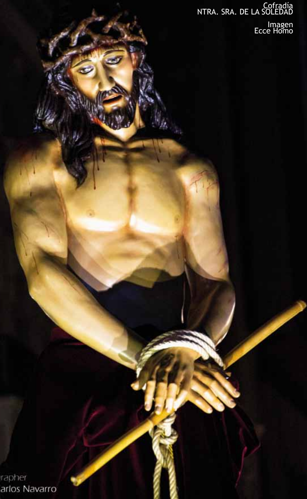
Imagen Ecce Homo