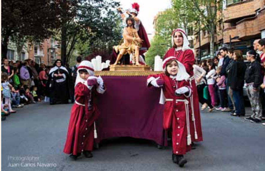
Cofradía STMO. CRISTO DE LA CORONACIÓN DE ESPINAS

Imagen Stmo. Cristo de la Coronación de Espinas (Réplica Infantil)