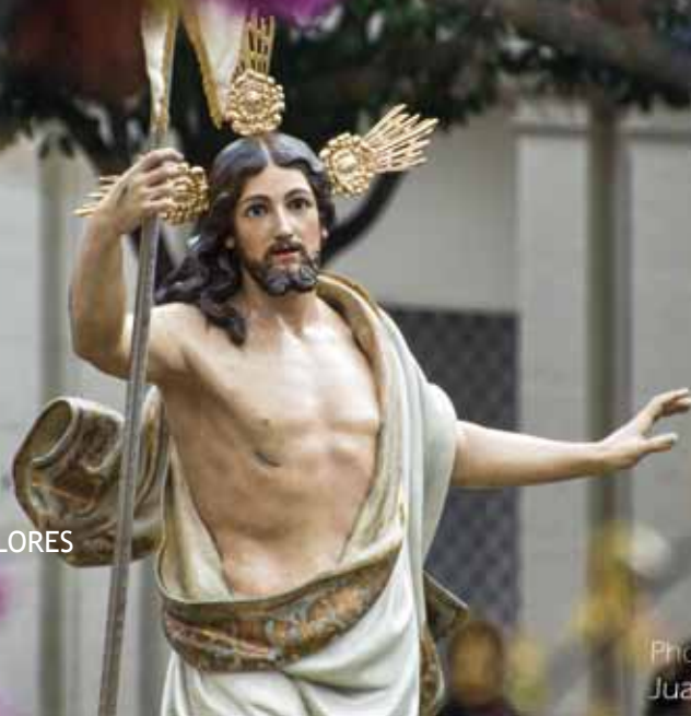
Imagen Cristo Resucitado